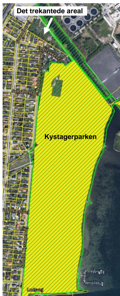
Planforhold i Kystagerparken

Administrationen vurderer, at etablering af en hundeskov umiddelbart vil være tilladt, da bestemmelsen giver mulighed for "anlæg eller lignende" på arealet.