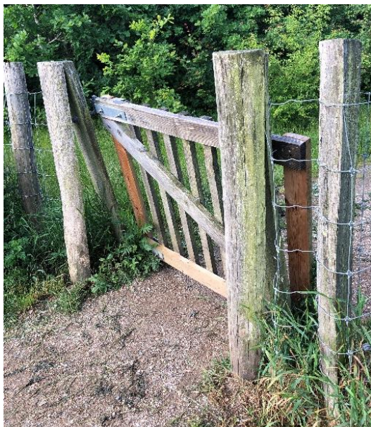
Reference foto af klaplåge og dyrehegn, foto af Brøndby Hundeskov.