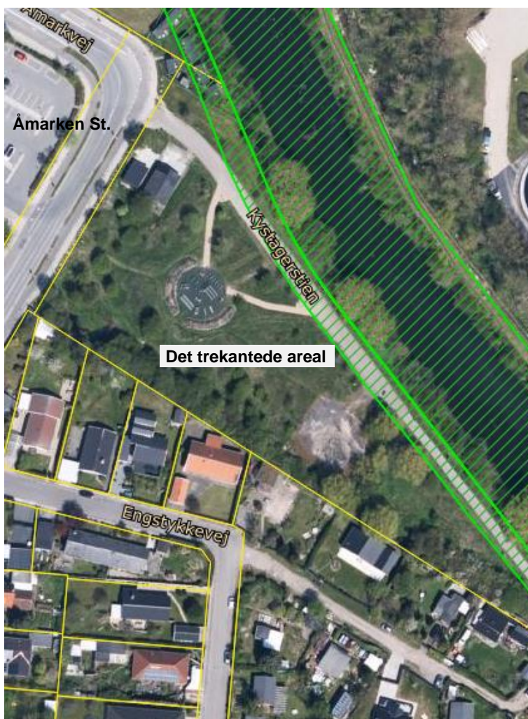
Planforhold i det trekantede areal i Kystagerparken