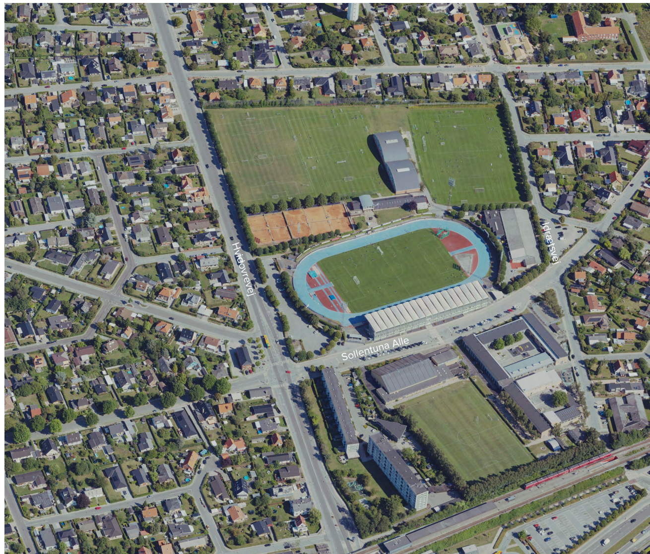
Luftfoto af Hvidovre Stadion.

Kommunen vurderer, at etableringen af faciliteterne er lokalplanpligtig. For at kunne vedtage den nødvendige lokalplan vil det desuden være nødvendigt gennem et tillæg til Kommuneplan 2021 at ændre rammebestemmelserne for kommuneplanens område 3D2 samt retningslinje 8.4.1 om parkering.